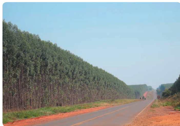
Plantación de eucalipto en Matto Grosso do Sul, Brasil.

Expertos de IPEN y de la Red Internacional de Plaguicidas (PAN) han participado en las discusiones del Comité de Examen de COP aportando información crítica sobre sus alternativas, preocupados por el uso indiscriminado de la sulfluramida. 28 Pero también ha participado la Asociación Brasileña de Fabricantes de Cebos Insecticidas (ABRAISCA), que agrupa a las tres principales empresas que fabrican sulfluramida, y oficiales del Ministerio de Agricultura de Brasil junto con académicos agrícolas; todos ellos han insistido en que no hay alternativas tan eficaces como la sulfluramida, en cultivos agrícolas como pastizales para el ganado y plantaciones de árboles a gran escala 29 , y que la sulfluramida es imprescindible para el agronegocio brasileño afirma ABRAISCA. 30