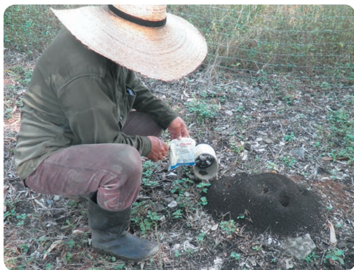
Campeño en Colombia aplicando sulfluramida. Foto: Plácido Silva, COLNODO, 2019

A pesar de la peligrosidad del PFOS, se han realizado varias exenciones a su uso. Uno de los “usos aceptables” es el empleo de sulfluramida en cebos para el control de hormigas cortadoras de hojas de los géneros Atta spp. y Acromyrmex spp. La novena Conferencia de las Partes del Convenio de Estocolmo, a celebrarse del 29 de abril al 10 de mayo de 2019, en Ginebra, Suiza, va a evaluar si las exenciones y “usos aceptables” para PFOS todavía son necesarios. Los gobiernos que son Parte van a tomar la decisión de aceptar o modificar la recomendación del Comité de Examen de Nuevos COP para permitir la sulfluramida para uso agrícola.