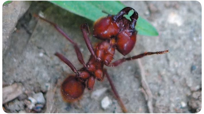
Hormiga del género Atta, Brasil

En México también hay insecticidas microbianos registrados, producidos con B. bassiana mezclado con extracto de Sophora sp. y Ricinus sp. para cebo en pellets como insecticida microbiano. También está registrada la marca Biodie, producto elaborado con Argemonina, Berberina, Ricinina y \alpha -Terthienil; y Metarhizium anisopliae como insecticida microbiano para infectar a hormigas forrajeras y para contaminar al nido siempre y cuando se infecte a través del alimento o de los mismos insectos, con varias marcas como Spectrum Meta, entre otras. 59