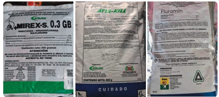
Marcas comerciales de sulfluramida en Costa Rica y Ecuador. Fotos: Fernando Ramírez y Angel Llerena, 2019

A pesar del daño que provocan es necesario entender el importante papel que juegan las hormigas cortadoras