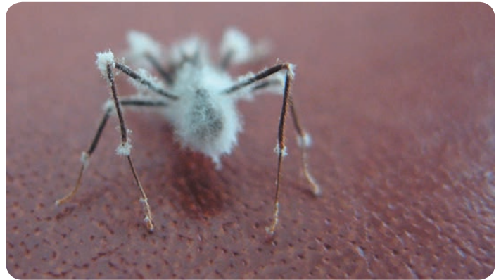
Hormiga (Atta insularis) muerta por el hongo Beauveria bassiana.

En Latinoamérica y el Caribe están disponibles las tecnologías para la producción de dichos agentes de control biológico y extractos vegetales, que van desde la producción artesanal a la industrial; Brasil es el país donde más se ha avanzado. Hoy existe suficiente evidencia científica del potencial de control de hormigas cortadoras con estos entomopatógenos, lo que se necesita es continuar las investigaciones sobre su integración con otros métodos de manejo: señalización de las poblaciones de hormigas (monitoreo) y de sus enemigos naturales; control cultural (por ejemplo, franjas de monocultivos de árboles intercaladas con franjas de bosque nativo); siembra de plantas repelentes como la Canavalia spp. y el Vetiver; y la aplicación de extractos botánicos como el obtenido de Tephrosia , empleado en la producción del producto comercial brasileño Bioisca.