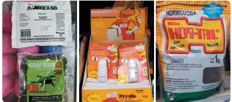
Marcas comerciales de sulfluramida para jardín en Porto Alegre, Brasil y Uruguay (proveniente de Argentina).

por los servicios que prestan a los ecosistemas: garantizan el flujo de nutrientes y energía, al llevar la materia orgánica de los nidos de un lugar a otro enriquecen de este modo el suelo 49 , lo que es importante en la protección de este último; también favorecen el drenaje y la penetración de las raíces por la remoción profunda del suelo al construir sus nidos que forman una red de extensas galerías. Estos efectos benéficos deben ser considerados en el momento de decidir las prácticas para su manejo en el contexto de la agricultura sostenible, como reconoce el informe de Naciones Unidas. 50