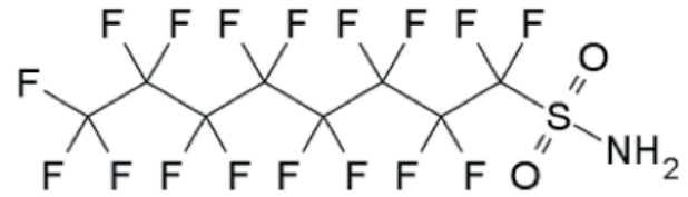
Figura 1: Fórmula estructural de la sulfluramida

En la figura 2 se muestra la estructura fundamental del anión PFOS, cuya fórmula molecular es C_8F_{17}SO_3 .