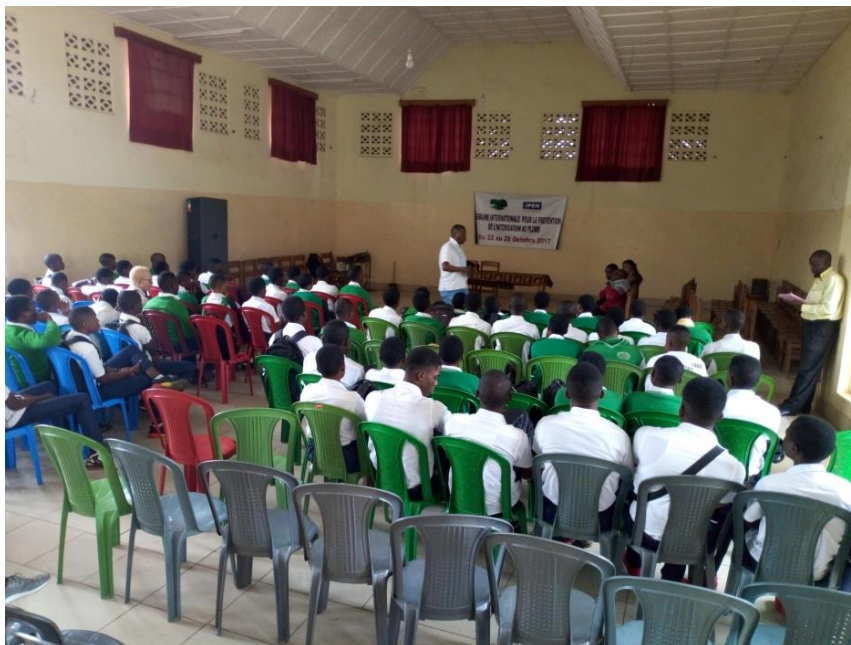
Elèves de 6 e année Informatique et commerciale de l'Inst. TUMAINI