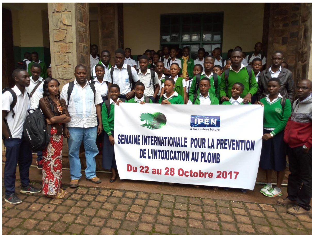
Photo de famille après sensibilisation des élèves de 6 e années