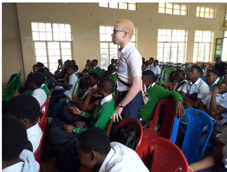
Elève de l'Inst. TUMAINI posant questions

Pour besoin d'utilisation, nous sommes disposés à vous envoyer d'autres photos si vous en avez besoin.