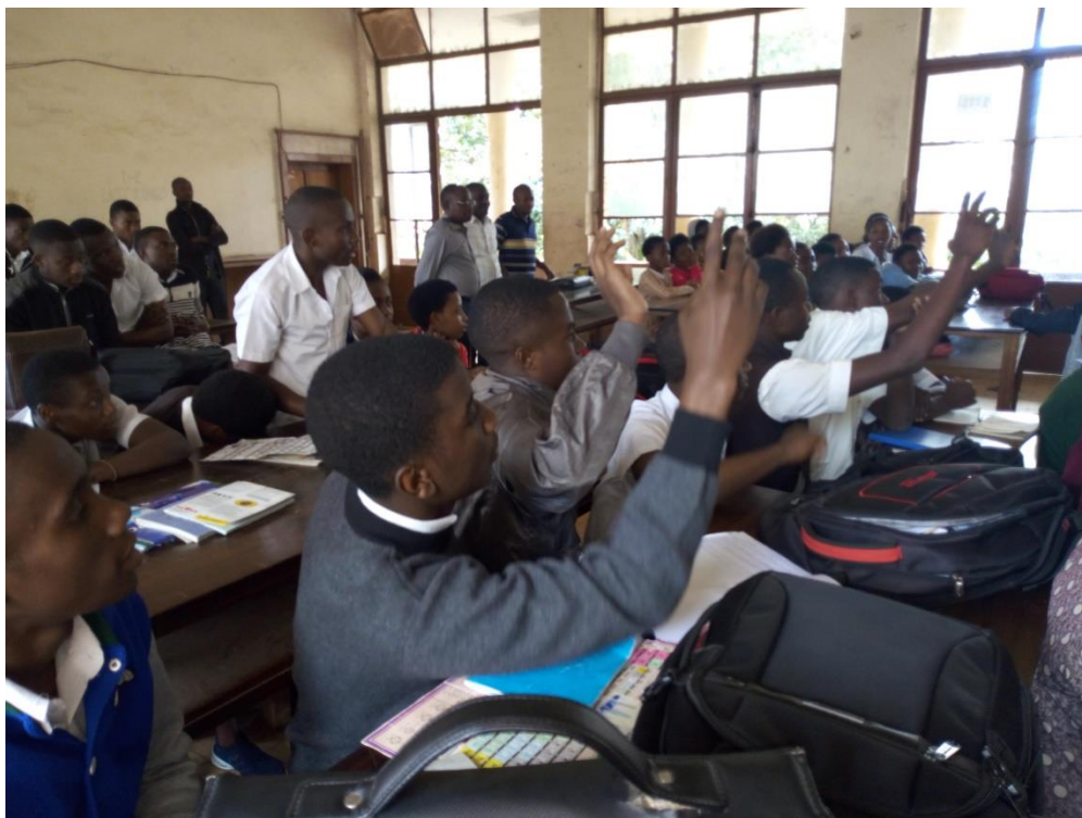
Interventions des élèves de l'Institut Athénée d'Ibanda