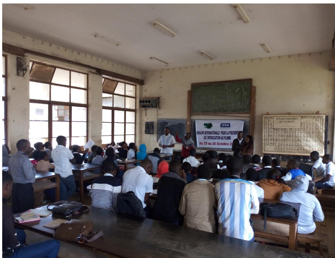
Elèves de la 6 e année Biochimie de l'Institut Athénée d'Ibanda