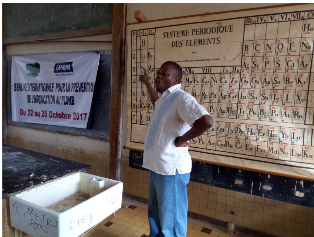
Explication sur le plomb