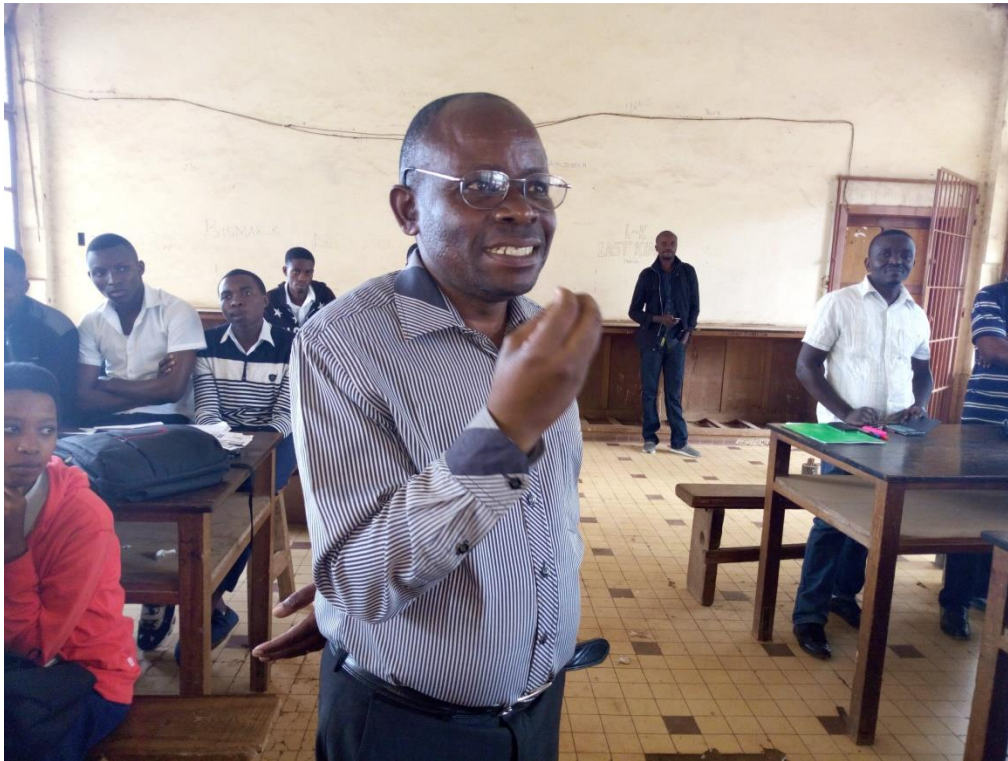
Le proviseur Kasambi intervenant en pleine sensibilisation