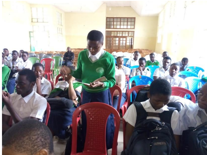
Elève posant questions