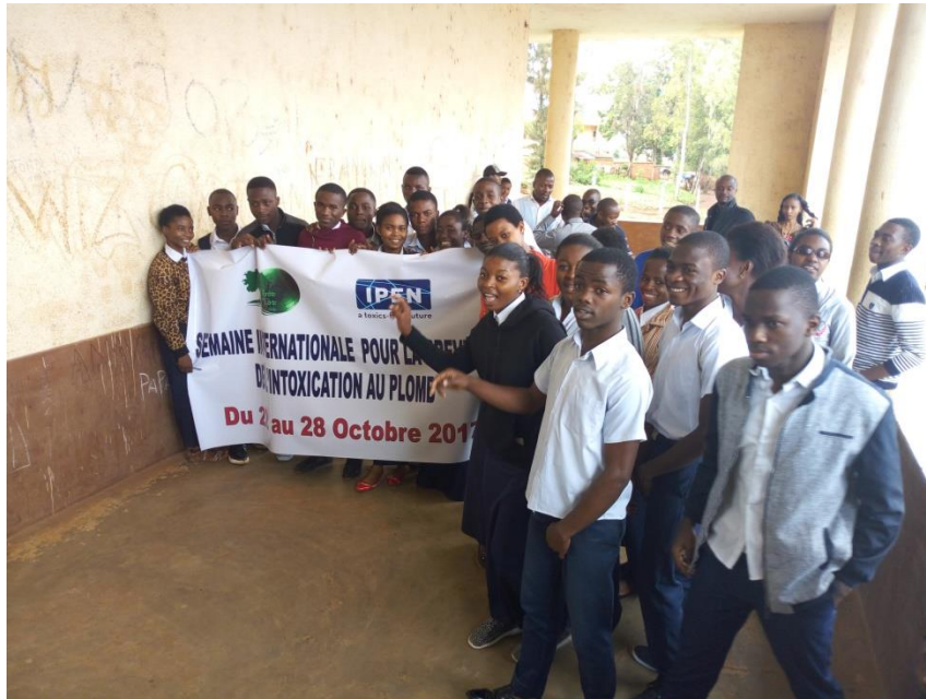
Photo de famille avec élèves de Biochimie de l'Athénée