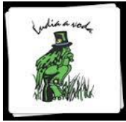
Michal Kravčík, People and Water Slovakia