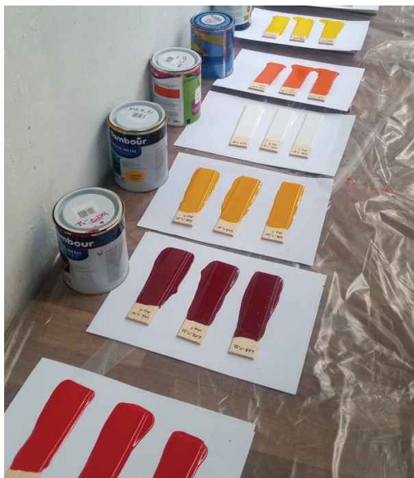
Иллюстрация 2. Подготовка образцов краски в г. Алматы, Казахстан.

закрывающиеся пластиковые пакеты и отосланы на анализ в Forensic Analytical Laboratories, Inc. в США для определения уровней общего содержания свинца. Эта лаборатория принимает участие в программе аккредитации экологических лабораторий для определения свинца (ELLAP), которая поддерживается Американской ассоциацией промышленной гигиены (AИHA). В процессе выбора