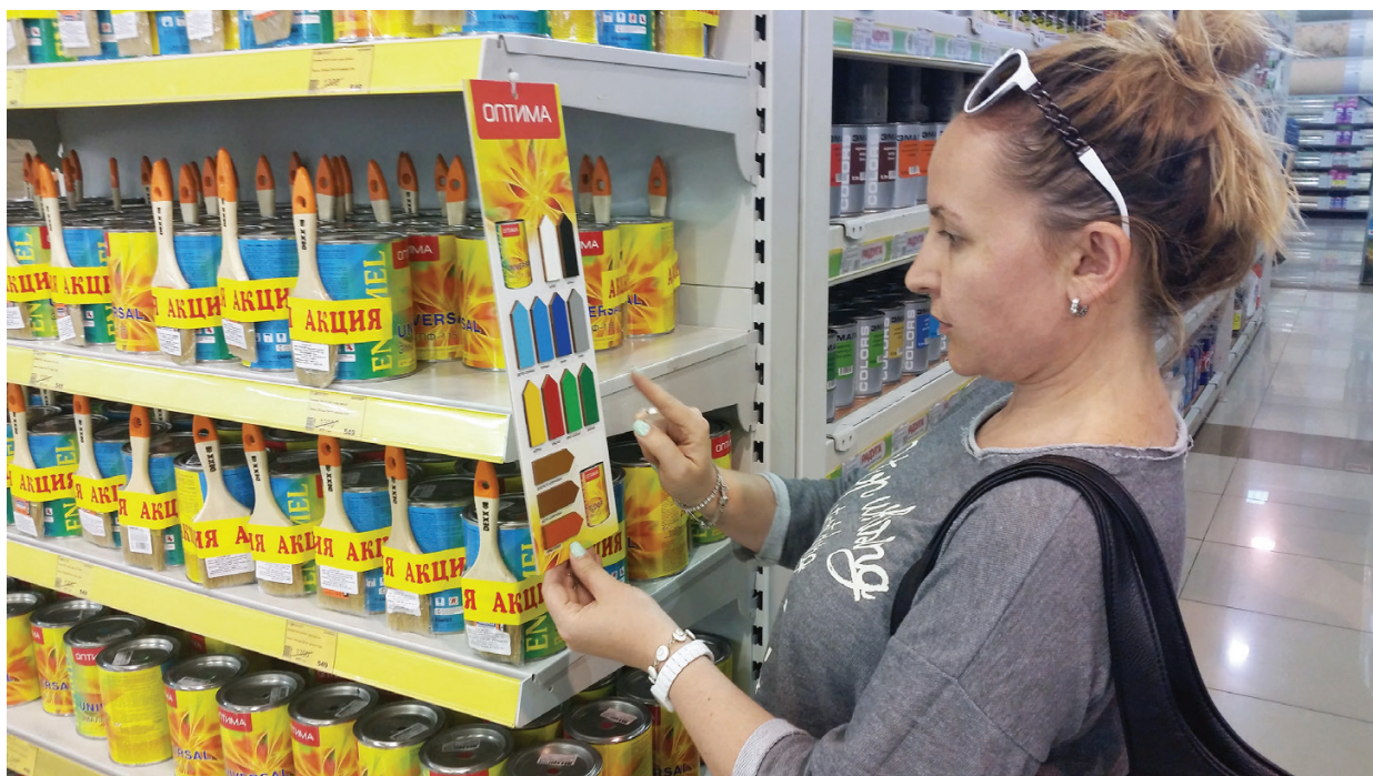
Иллюстрация 1. Обзор брендов и приобретение краски в г. Алматы, Казахстан.

Каждую мешалку и каждую кисть использовали только один раз и только для одного образца краски. При этом соблюдалась особая осторожность, чтобы избежать перекрестного загрязнения. Затем всем пробам давали высохнуть при комнатной температуре в течение пяти-шести дней. После высыхания окрашенные дощечки были помещены в индивидуально промаркированные